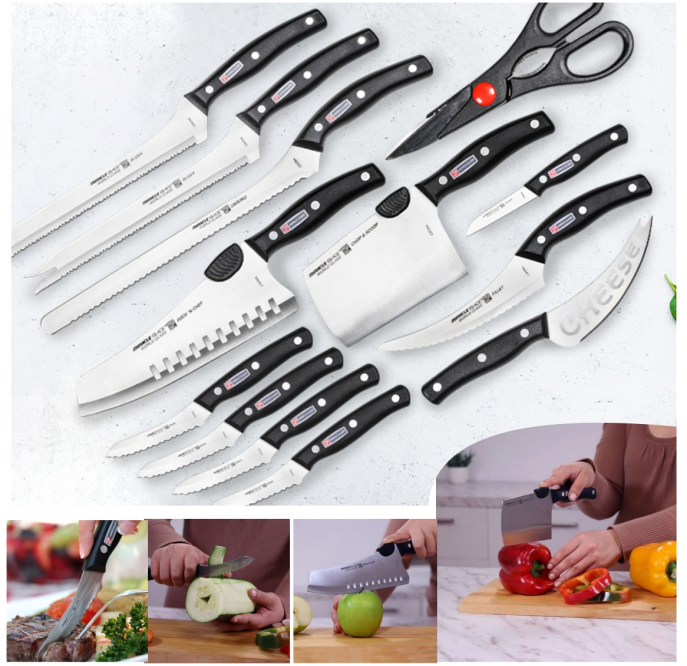
SET DE CUCHILLOS TRECE PIEZAS