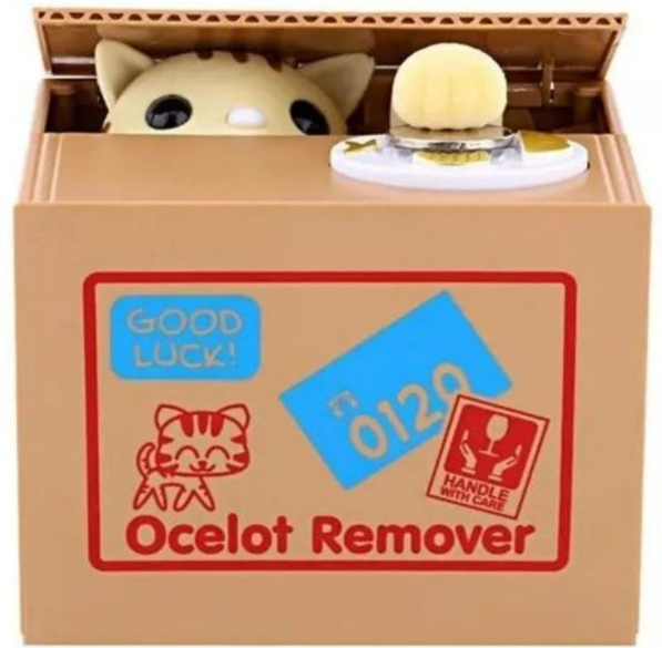
ALCANCIÁ DE GATO ROBA MONEDAS