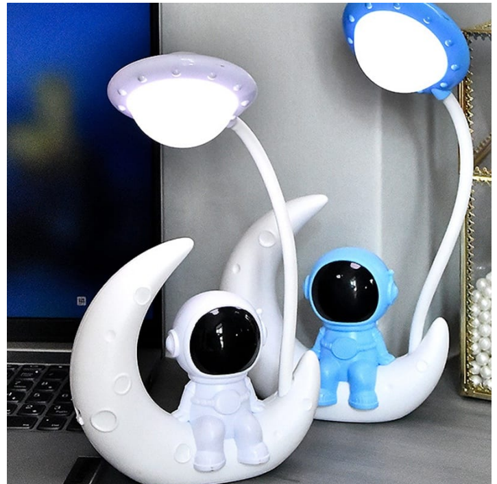
LAMPARA DE ASTRONAUTA