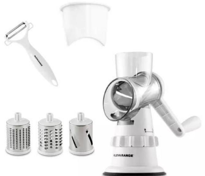
MOLINO PICA TODO