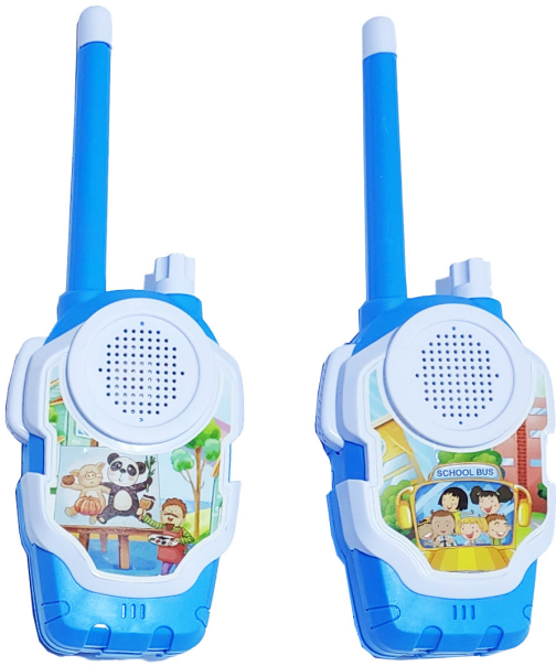
JUGUETE WALKIE TALKIES BOQUITOQUIS NIÑOS