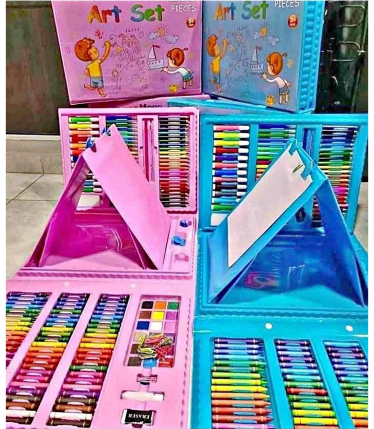
SET DE ARTE DE 208 PIEZAS