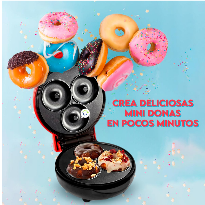
MAQUINA DE MINI DONAS