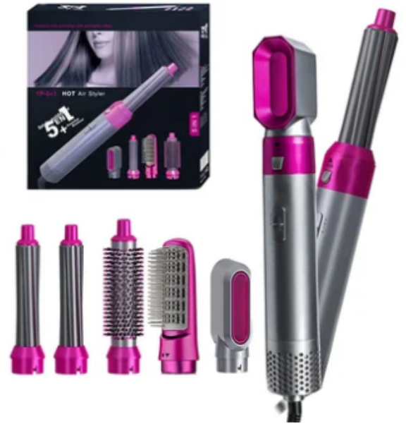
CEPILLO SECADOR 5 EN 1 PARA EL CABELLO