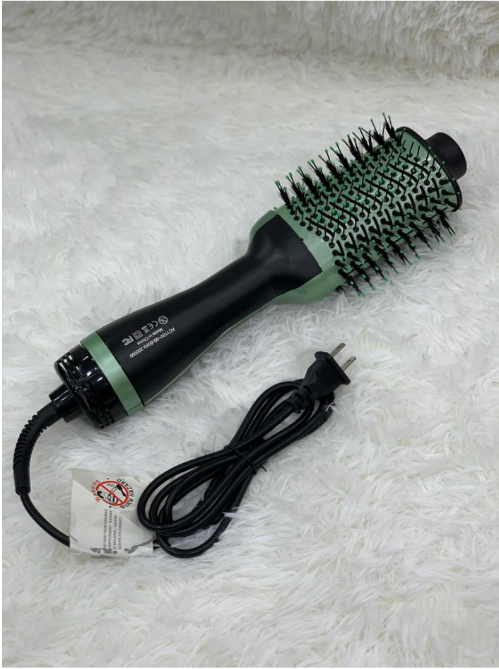
CEPILLO SECADOR Y ALISADOR DE AGUACATE