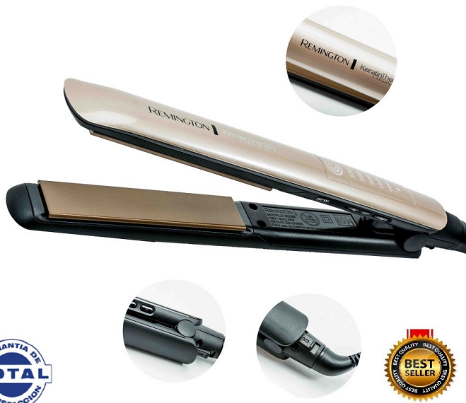
PLANCHA CABELLO REMINGTON KERATINA