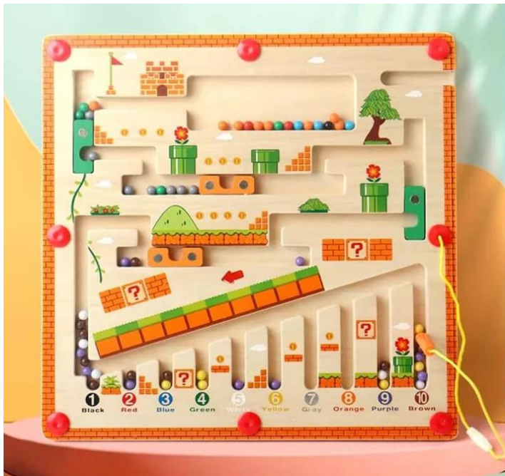
LABERINTO MAGNETICO SENSORIAL Y MOTRIZ