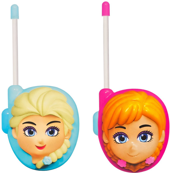
JUGUETE WALKIE TALKIES BOQUITOQUIS ELSA Y ANNA FROZEN