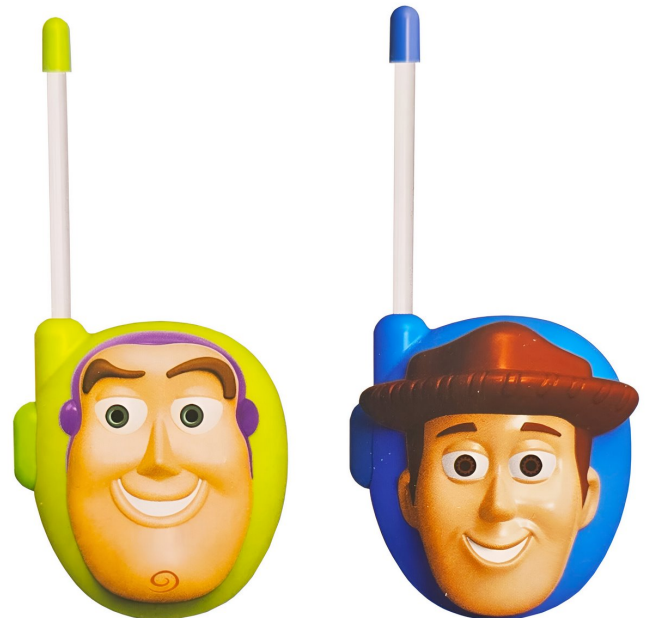
JUGUETE WALKIE TALKIES BOQUITOQUIS TOY STORY