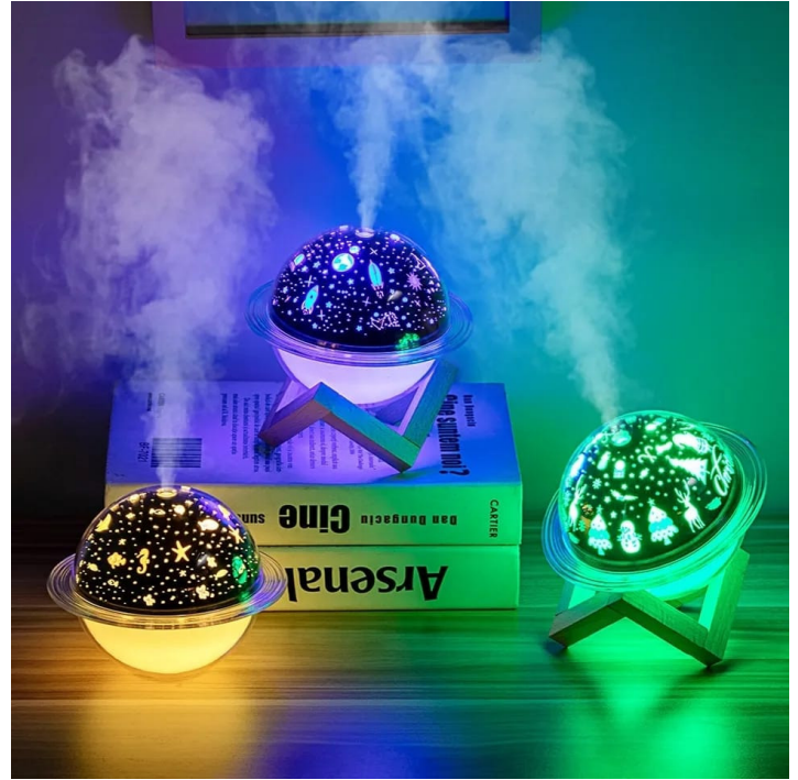
LAMPARA HUMIDIFICADORA CON BASE