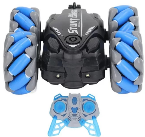
CARRO A CONTROL REMOTO TODOTERRENO