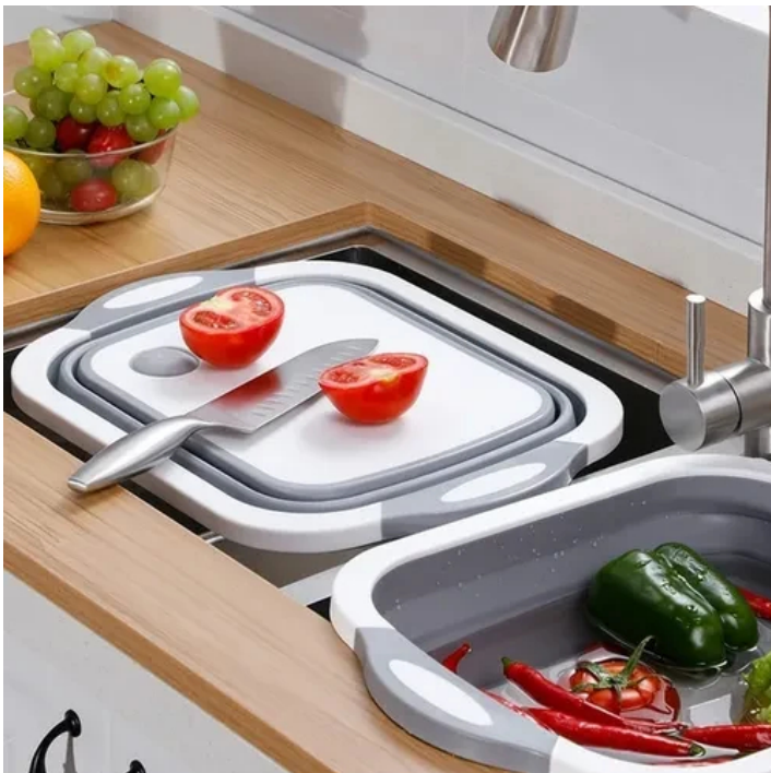
TABLA MULTIFUNCIONAL CON ESCURRIDOR