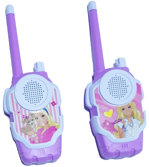
JUGUETE WALKIE TALKIES / BOQUITOQUIS BARBIE