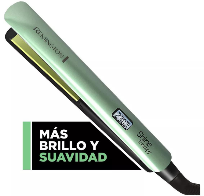
PLANCHA REMINGTON AGUACATE