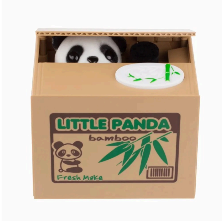
ALCANCIA DISEÑO PANDA