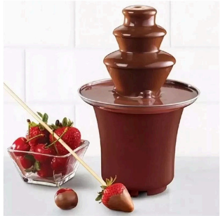
MINI FUENTE DE CHOCOLATE DE 3 NIVELES