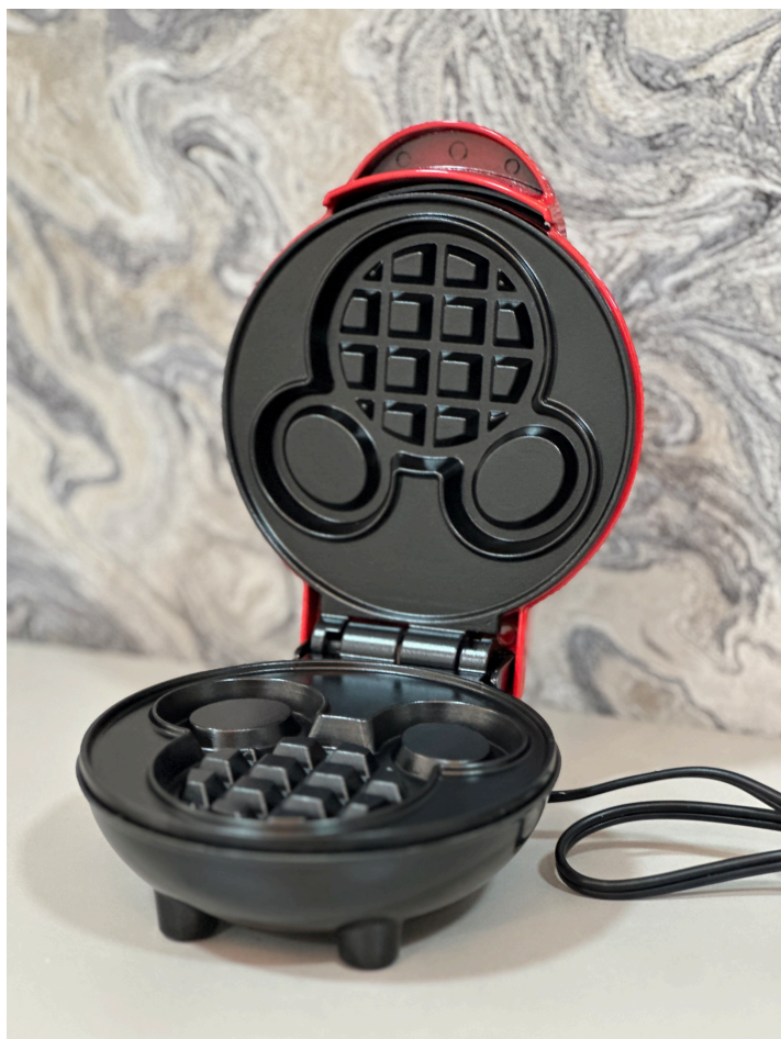
MINI WAFLERA DE MICKEY