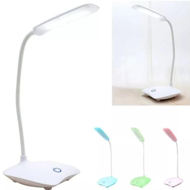
LAMPARA LED AJUSTABLE PARA ESCRITORIO