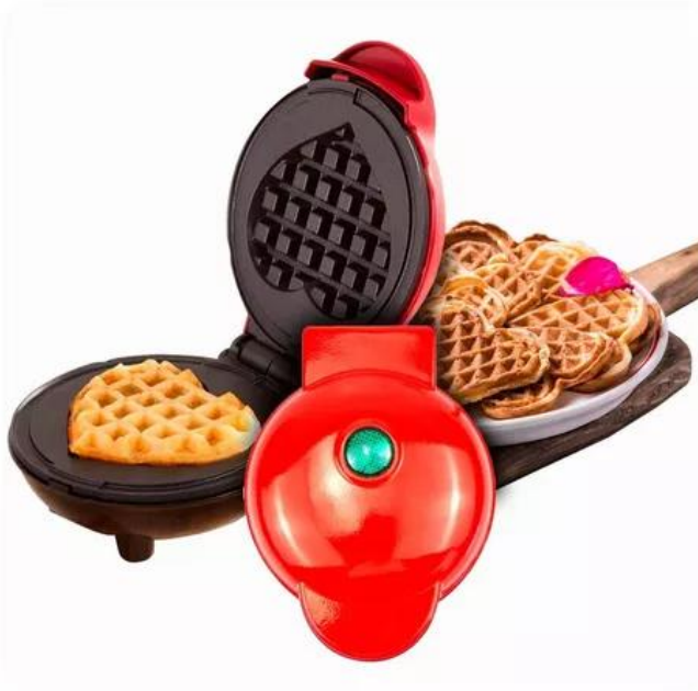
MINI WAFLERA CORAZON