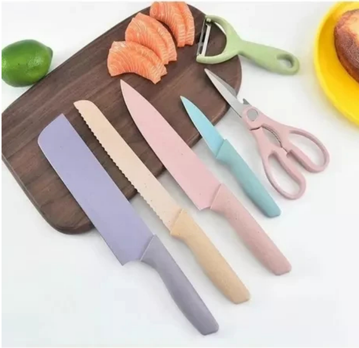
SET DE CUCHILLOS 6 PIEZAS