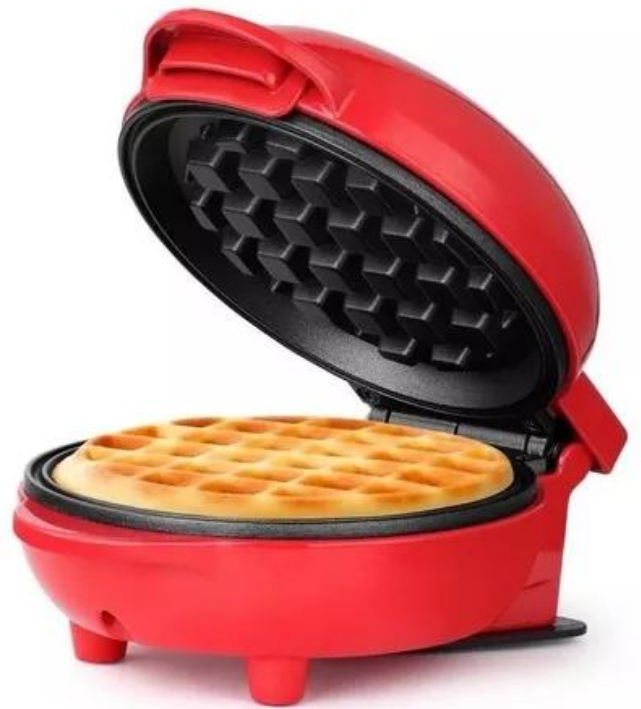
MINI WAFLERA GOFRERA REDONDA ANTIADHEREN