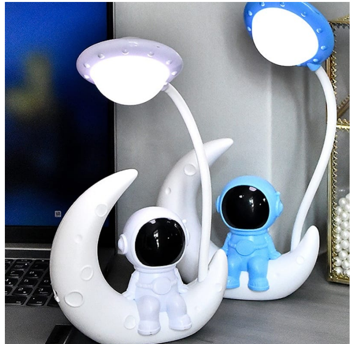
LAMPARA DE ASTRONAUTA