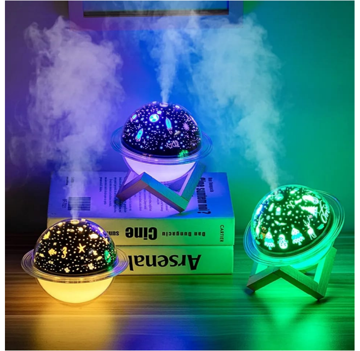
LAMPARA HUMIDIFICADORA CON BASE